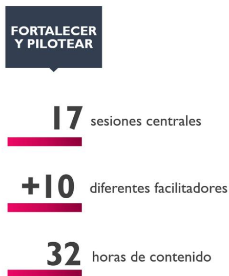
Gráfico 2: Piloting - BCtA

Elaborado por: Business Call to Action - BCtA